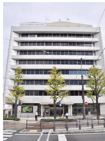
【リジェール松山ホームページ】