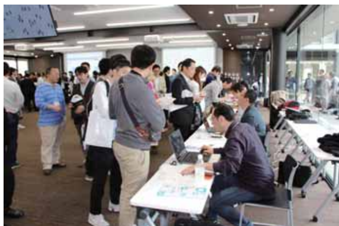
クラウドシステム「kintone」を使って参加者がファンディング