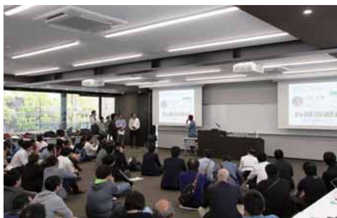
5人のプレゼンターが3分ずつ自己PR・事業紹介

交流会のテーマは「つながる。広がる。うまれる。起業家の応援を通じて地域を活性化」です。地域の起業家が自身の事業や取り組みについて3分間のプレゼンを実施し、交流会参加者は自分の一票を、応援したいと思う起業家に投票することができます。そして交流会参加費の一定割合が得票数に応じて起業家に賞品として資金提供されると同時に、人的ネットワークを広げる場にもなっています。